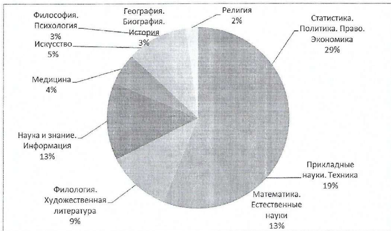
Рис. 2. Распределение электронных изданий, зарегистрированных в 2019 году, по тематическому составу

Анализ зарегистрированных в 2019 году электронных изданий по целевой аудитории (возрастным категориям) показал, что электронные издания для взрослых составляют более 98%, электронные издания для детей и юношества – 2 %. Такие показатели обусловлены тем, что выпуском изданий для детей в основном занимаются специализированные тиражные издательства, продукция которых регистрируется в качестве обязательного экземпляра электронных изданий не в полном объеме.